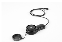
Sensore di illuminamento LP-10B (per LXP-10B)