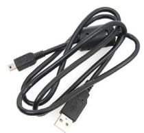
Cavo mini USB