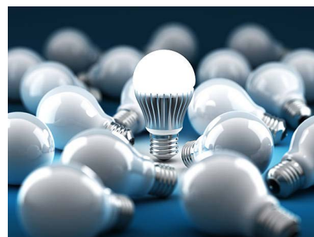
Misura dell'illuminamento LED

Dispositivo di altissima classe A. Permette l'esecuzione di misure più precise nelle aree industriali e negli impianti di utilità pubblica. In aggiunta, lo strumento permette il trasferimento wireless dei dati al programma informatico Sonel Reader.